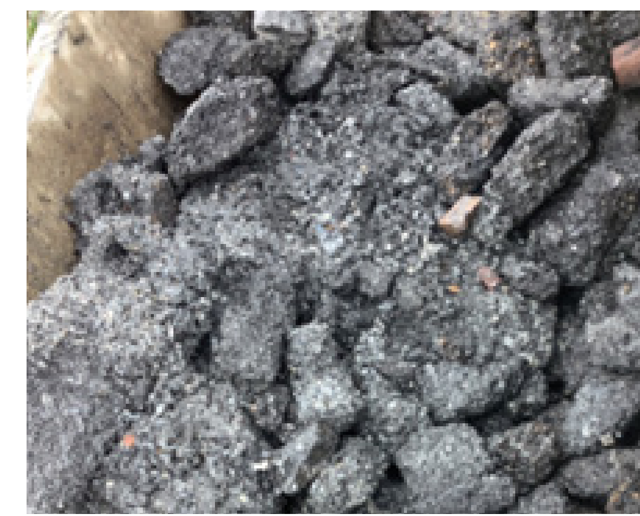
Voorbeeld asfalt- en gietasfalt in kreukelberm