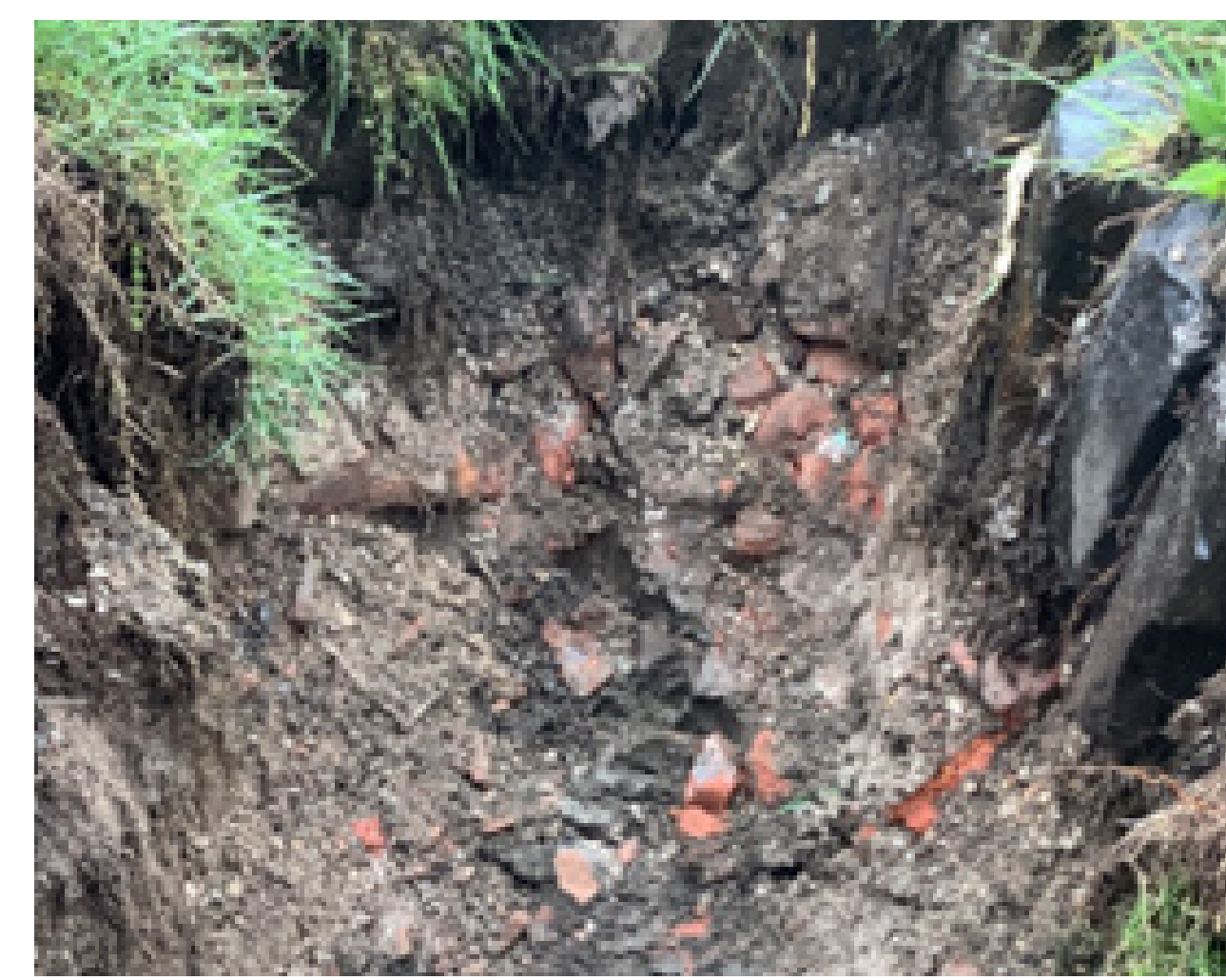
Voorbeeld asbest onder zetsteen (dijkvak 2 Zuidkade)