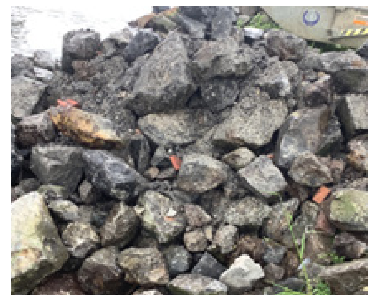
Voorbeeld samenstelling kreukelberm