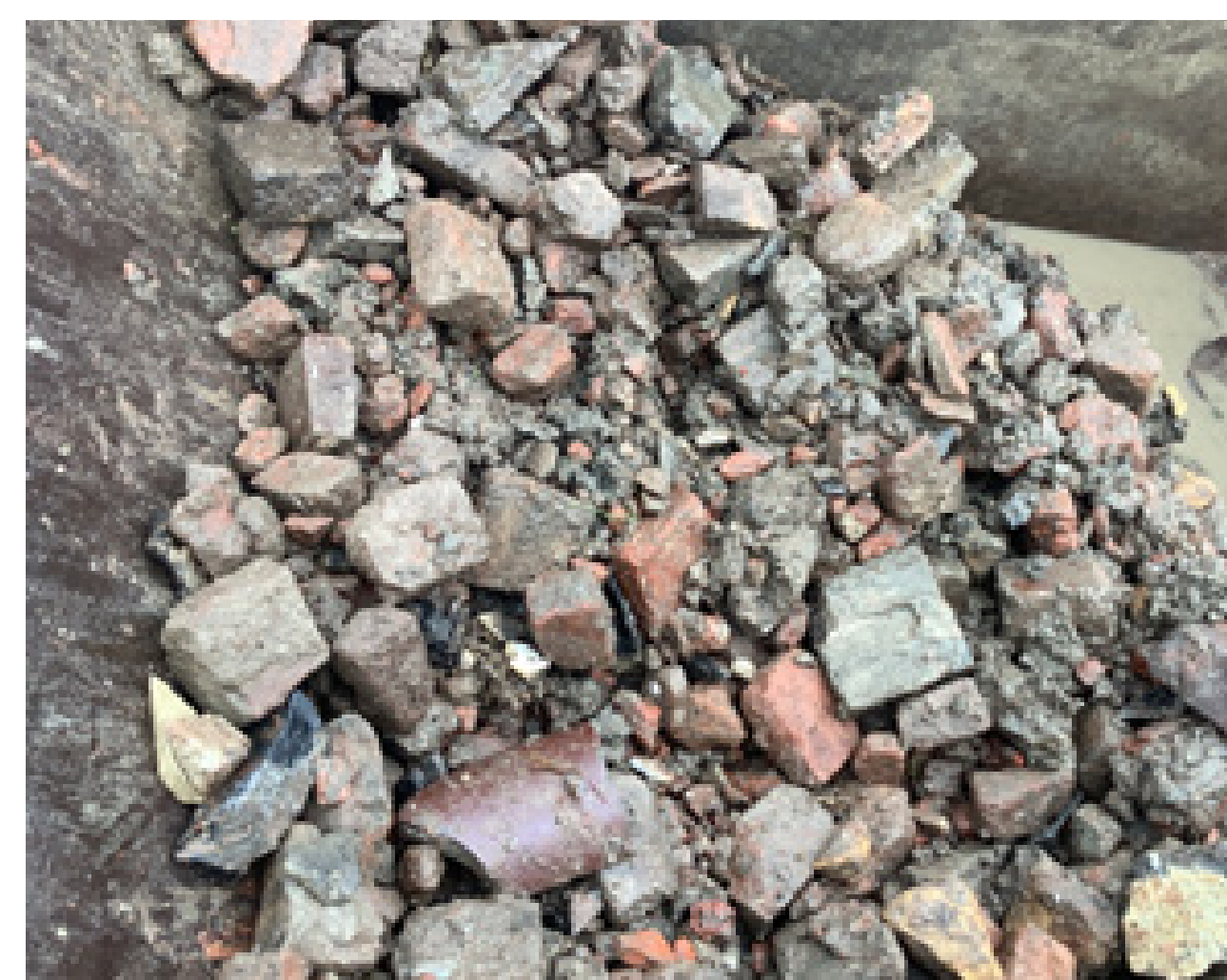
Voorbeeld materiaal na milieukundige zevingen

Deze vervuiling gaat voor het grootste gedeelte worden ingepakt in de nieuwe dijk. Een klein deel van de vervuiling dit buiten het nieuwe profiel valt wordt veilig afgegraven en afgevoerd.