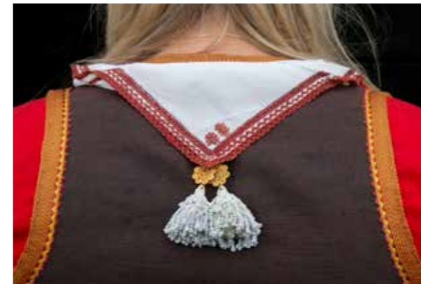
Doekje met rood voor bruid.