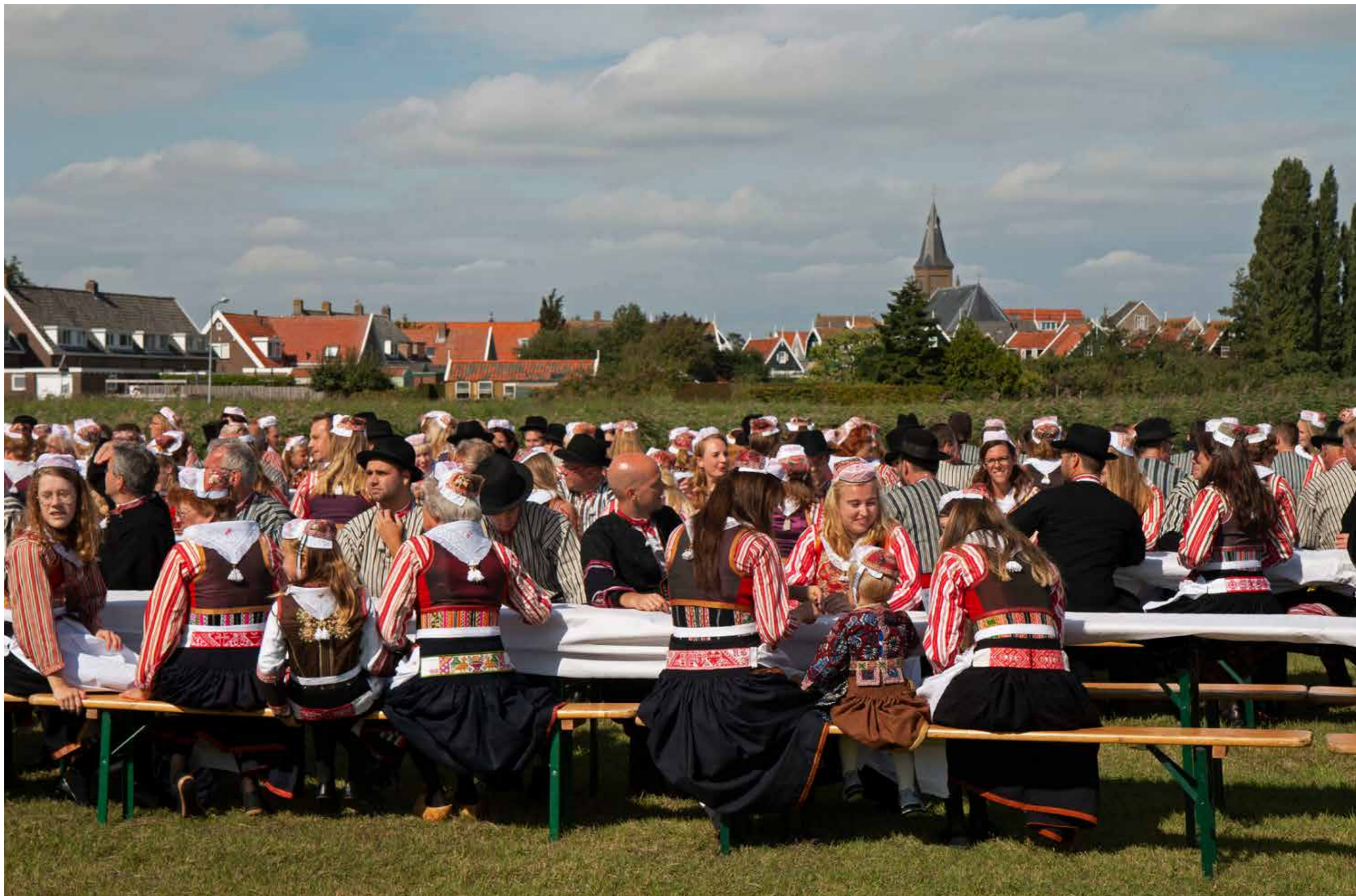
Bruiloftsgasten tijdens ijsbruiloft.