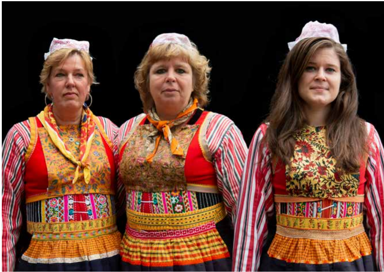
Oranjedracht op Koningsdag.