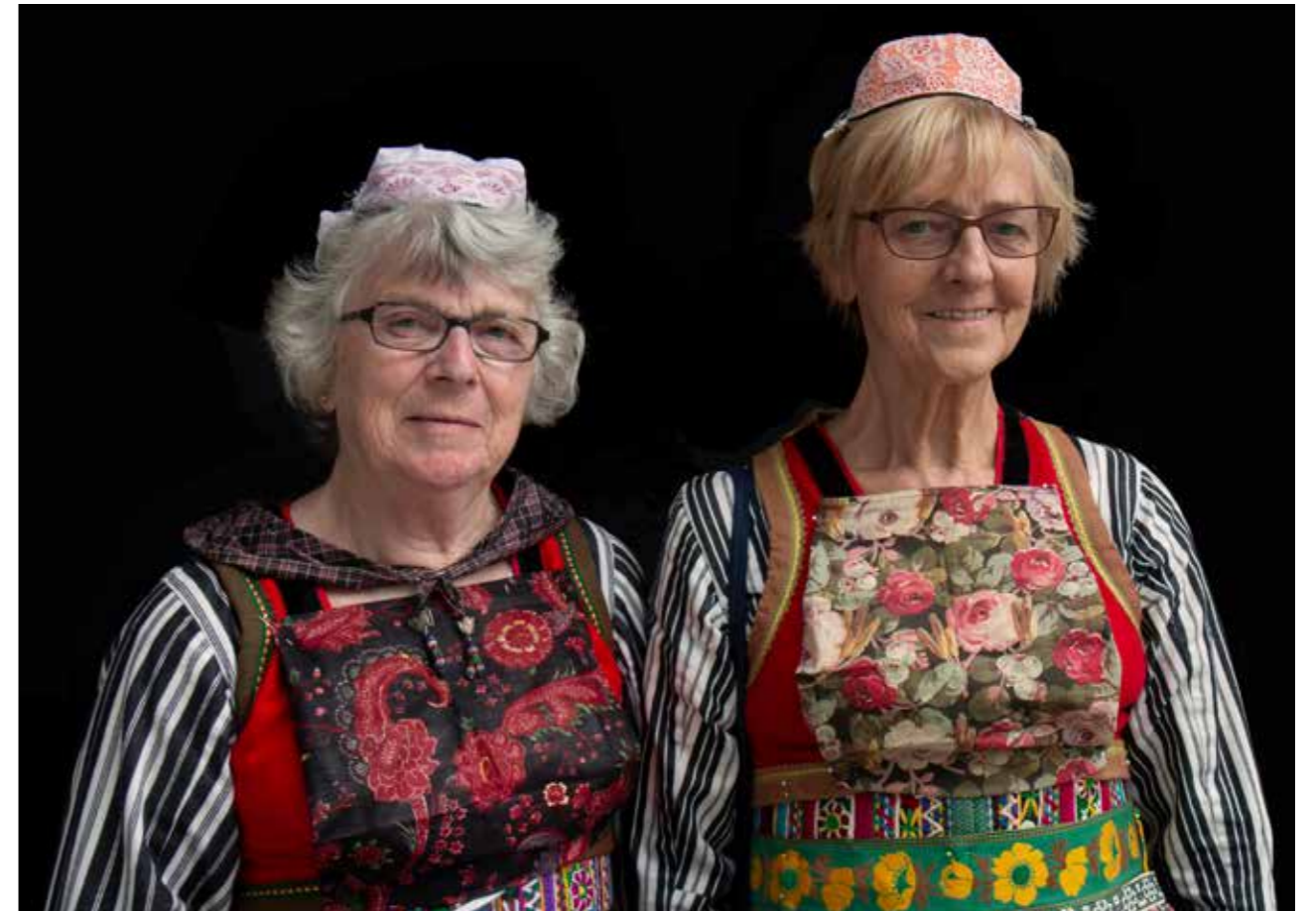
Donkere rouw (links) en lichte rouw.