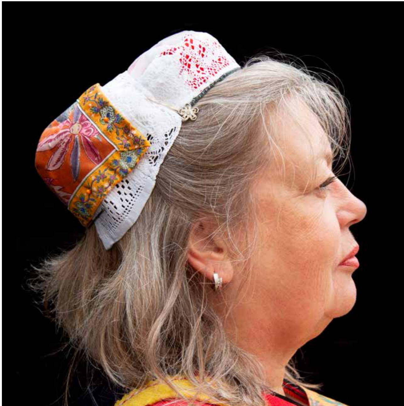
Oranjedracht op Koningsdag.