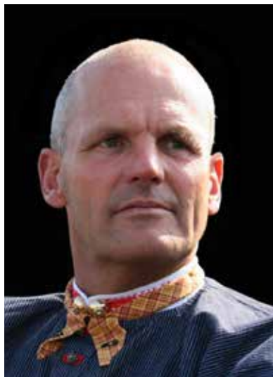
Oranjedracht op Koningsdag.