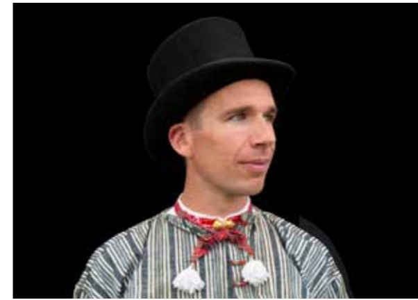
Bruiloftsgast met hoge hoed.