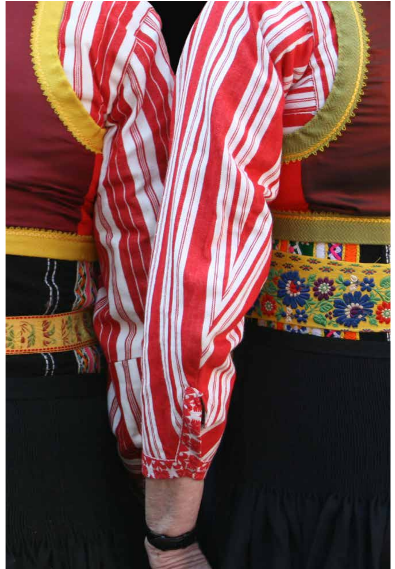
Oranjedracht op Koningsdag.