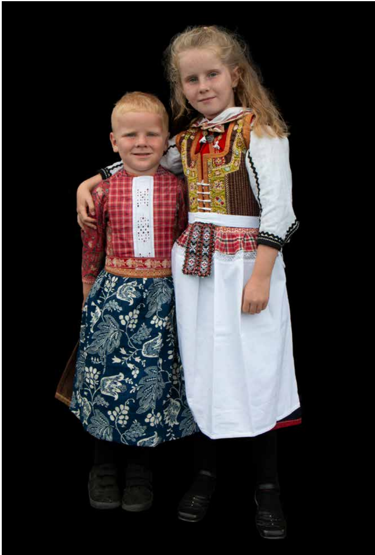
Jongen en meisje in bruiloftsgastendracht 19de eeuw.