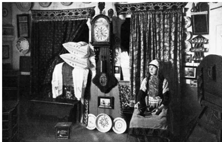
±1910. Interieur traditioneel Marker huisje.

Tot de aanleg van de Afsluitdijk leeft de bevolking van Marken voornamelijk van de visserij. Op het kleine eiland in de Zuiderzee is nauwelijks ruimte voor land- en tuinbouw waardoor de mannen lange tijd op zee doorbrengen. De achtergebleven vrouwen kunnen daarom veel tijd besteden aan het vervaardigen van authentieke kledingstukken. Voor bijna elke gelegenheid is er een aangepast kostuum. In 1957 komt een verbinding met het vaste land en komt het toerisme op gang waarbij de dracht een kleurrijk onderdeel vormt.