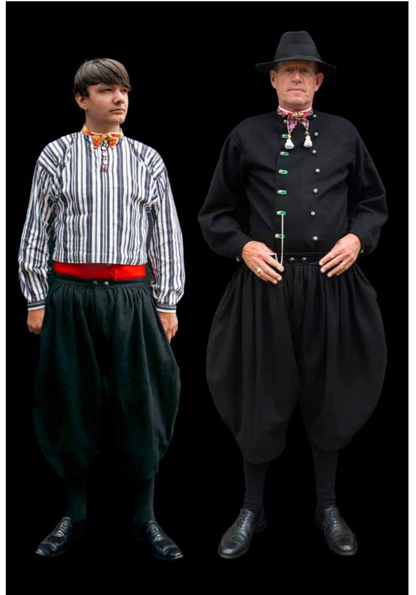
Oranjedracht op Koningsdag.