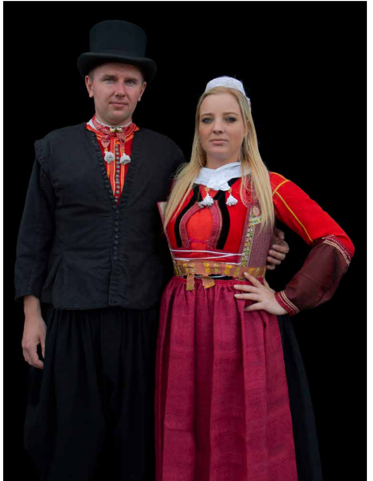
Bruid ter kerke 18de eeuw.