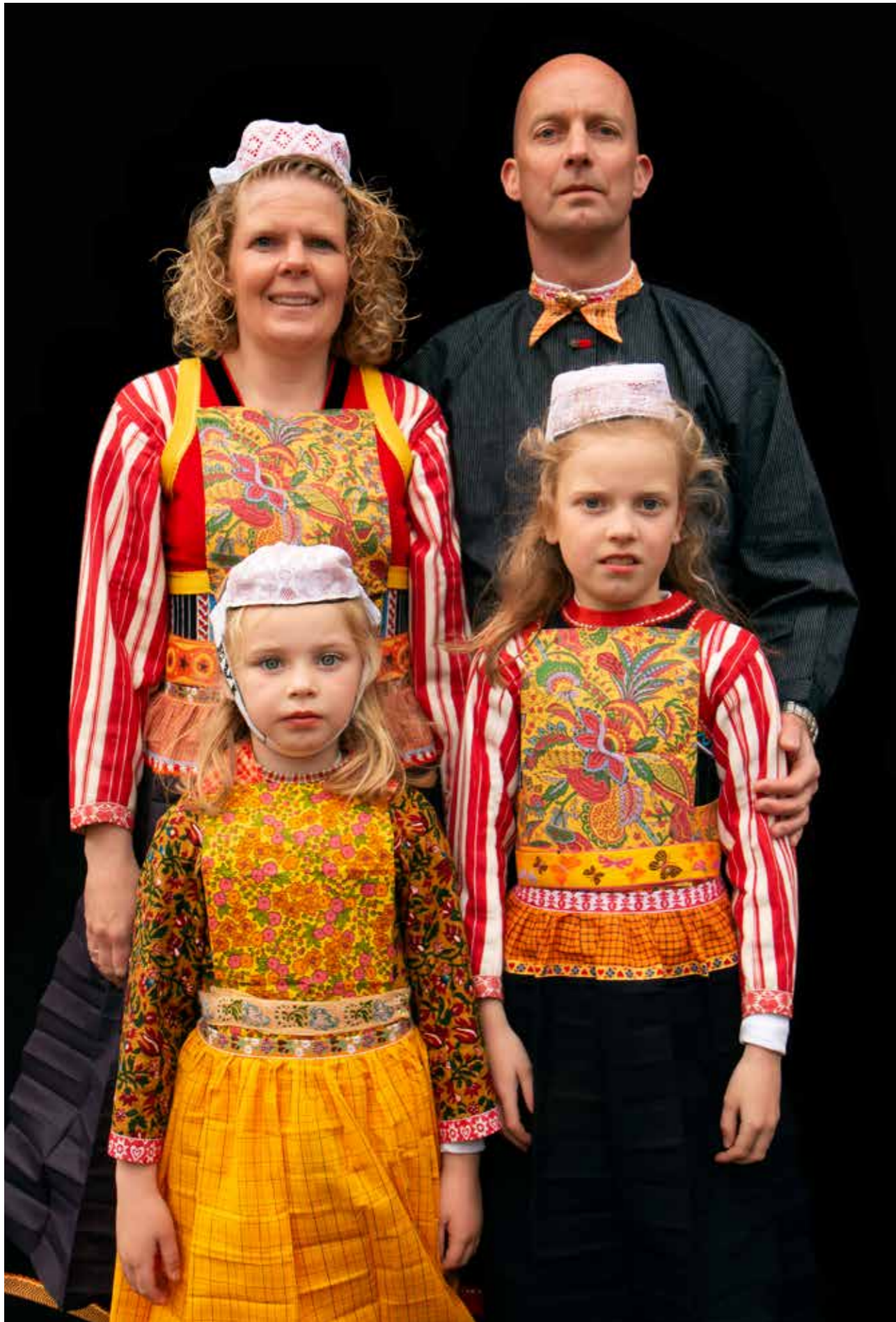
Oranjedracht op Koningsdag.