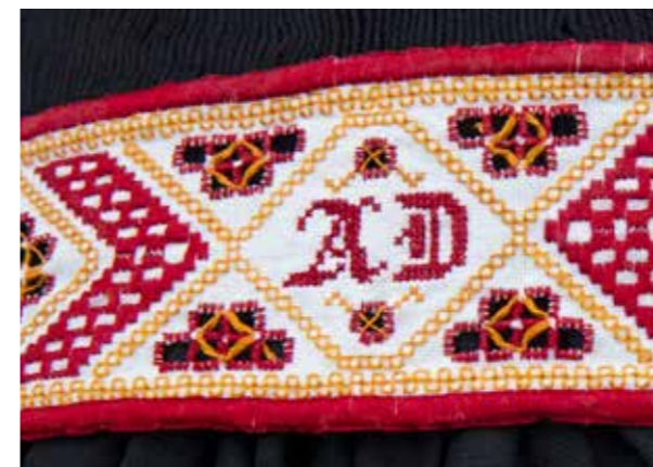
Geborduurde achterband met initialen.