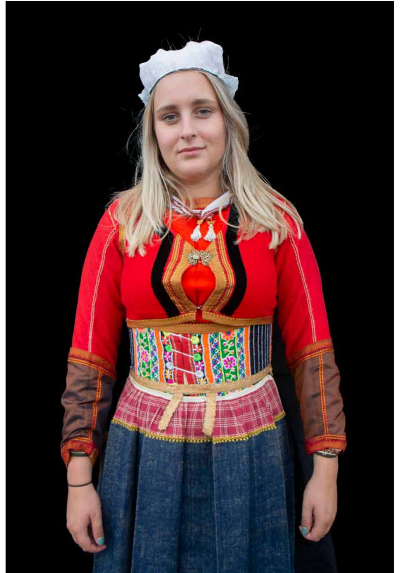
Ondertrouwdracht rode bruid ±1950.