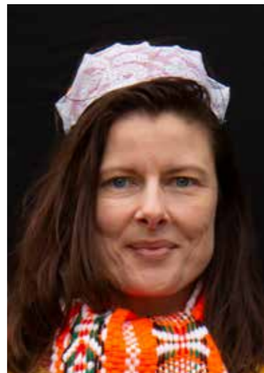
Oranjedracht op Koningsdag.