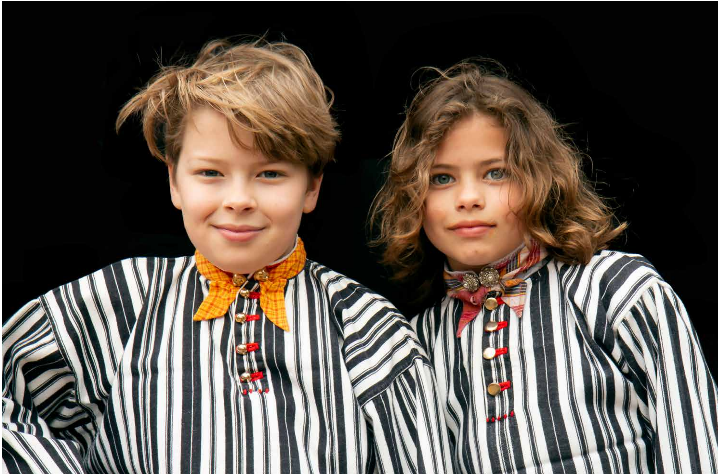
Oranjedracht op Koningsdag.