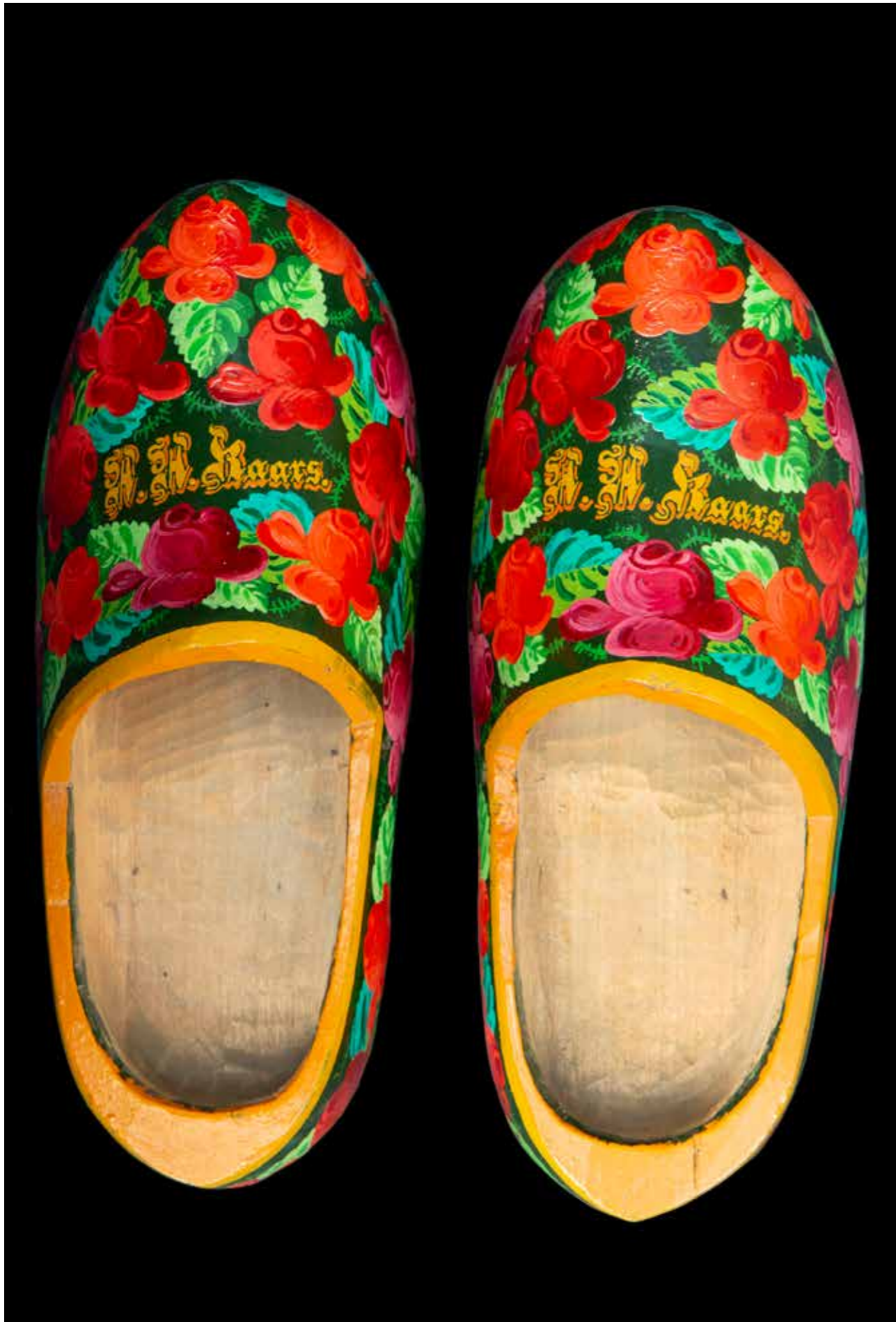
Meisjesklompen 'rozenulften' ±1950.