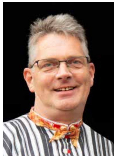
Oranjedracht op Koningsdag.