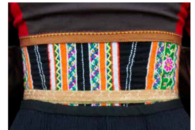
Achterzijde voorpanden en rijglif.