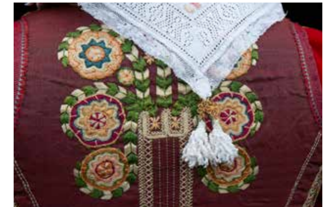
Rijglif met 7 rozen en wit bruidsdoekje 19de eeuw.