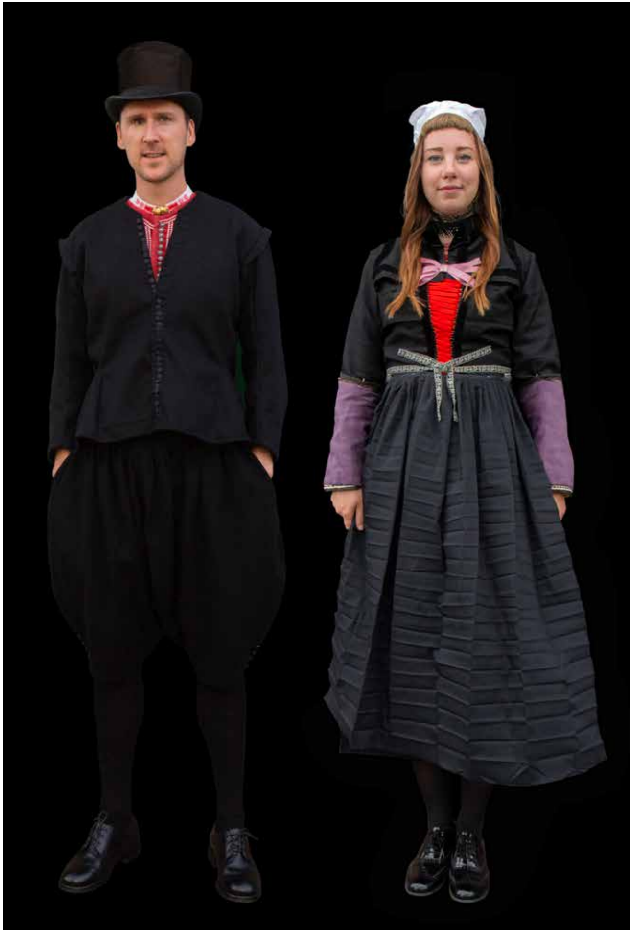
Trouwdracht 16de eeuw.