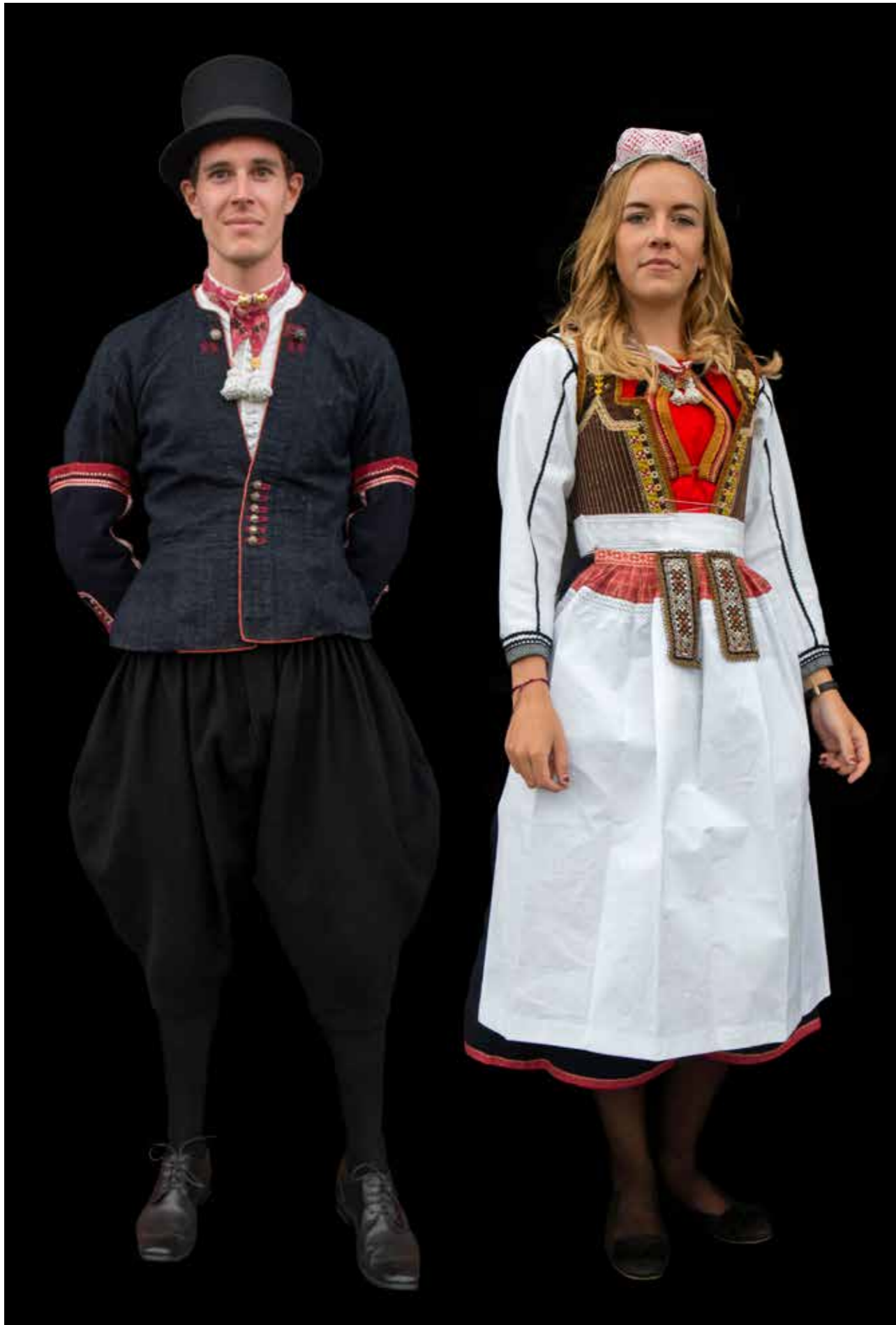
Trouwdracht bruidegom 19de eeuw.