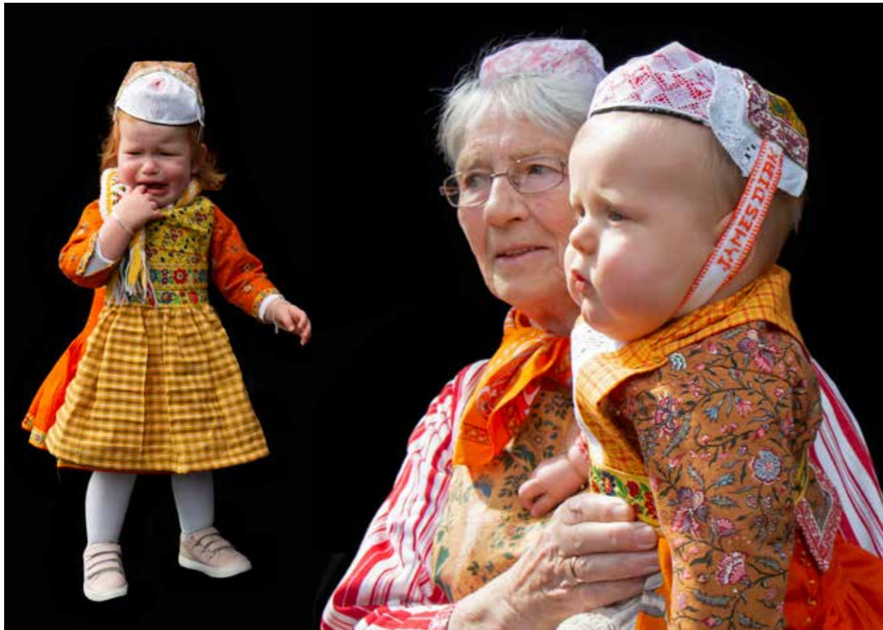
Oranjedracht op Koningsdag.