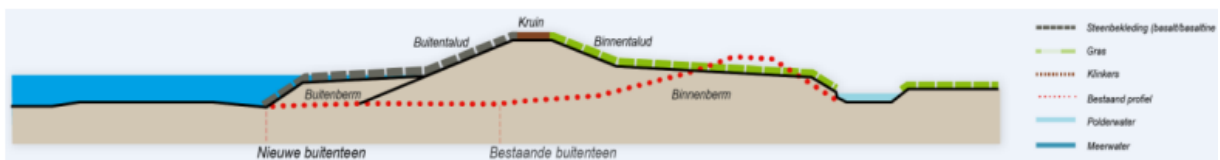
Figuur 2.5 Dwarsprofiel Zuidkade, compact profiel

Hierbij behoren de volgende indicatieve dimensies: